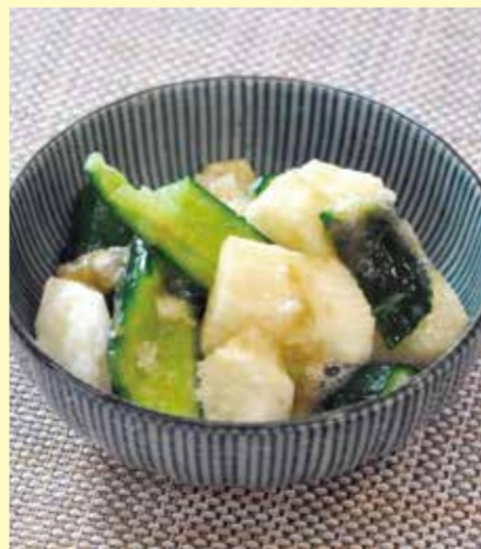
1人分食塩相当量:0.7g 調理時間:10分

【作り方】 ①長芋は皮をむき、きゅうりは塩(分量外)をふいてこすり洗いする。ピーラーに入れ、めん棒などであらく砕く。 ②ボールに①を入れ、とろろこんぶとしょうゆを加えてあらたできあがり。