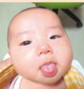
発達すると見られなくなります

地域に足を踏み出して、さまざまな人々と一緒に活動する中から「協働」新しい発見が生まれています。