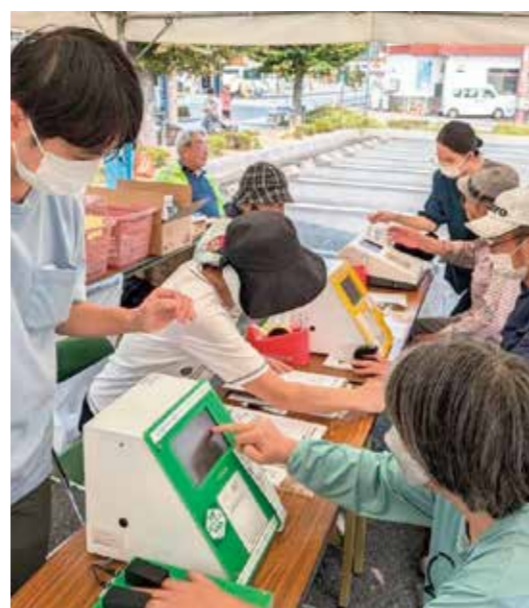
健康チェックには途切れなく順番待ちが

《応募方法》 ハガキに、答え・身近なこと・ご意見・ご感想など何か一言と、住所・氏名・年齢・電話番号を書いてお送りください。正解者の中から、抽選で賞品をお送りします。当選者の「一言」は掲載させていただきます。 ☆賞品: QOカード ☆締切: 12月20日 ☆発表: 第671号 ☆あて先: 〒717-8025 岡山県倉敷市水島南春日町13-1