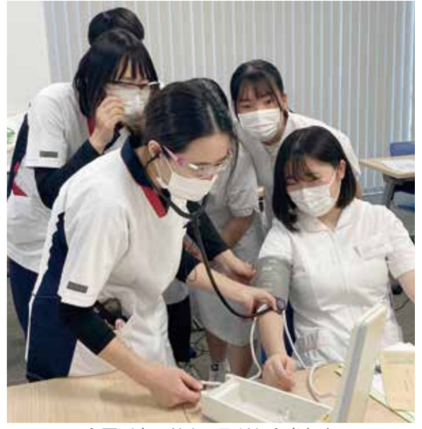
血圧測定に熱心に取り組む参加者

コープリハビリテーション病院は、春の高校生1日看護体験を行い、8人の生徒が参加しました。病棟説明から車椅子への移乗動作や手洗い、薬液の吸い上げなどを実際に実践してもらいました。患者さんが安全に移乗でき