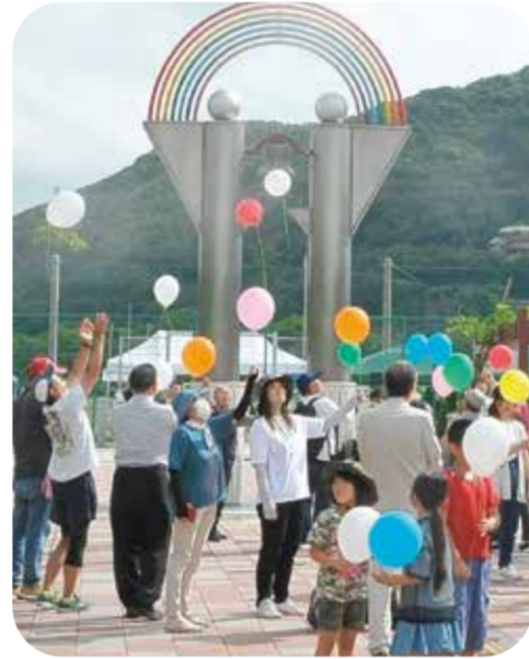
平和の願いを託して