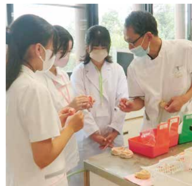
新しく作製した入れ歯の説明を聞く参加者たち

水島歯科診療所は7月25日に、高校生の医療体験を行い、3人が参加しました。歯科医師や歯科衛生士、歯科技工士などの職業体験を通して、将来の職業選択の参考にすれば、高校生を対象に毎年、春