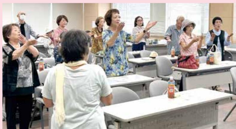
手話を使って「四季の歌」を歌いました(8/6)

大高支部健康まつりが8月6日、くらしき健康福祉プラザで開かれ、24人が参加しました。健康チェックでは、野菜の摂取度を測定。良い結果が出た方は「家庭菜園のトマトを食べているからかなあ」と笑顔で話していました。手話を使って「四季の歌」を歌ったり、ビンゴゲームをしたり、楽しんで交流しました。