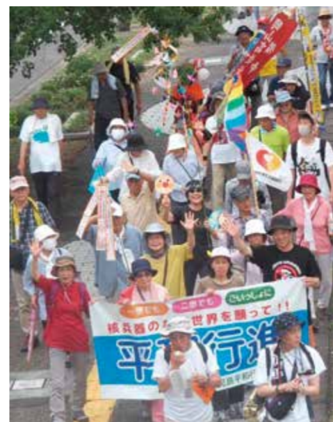
児島を元気に進行中(7/15)

2024年夏、核兵器廃絶を目指す「国民平和大行進」が児島行進(7)で取り组まれました。