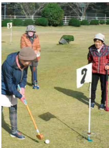
おしゃべりして、愉しく交流

水島支部は11月30日、環境問題をテーマに健康まつりを開催しました。 地域の方々にも広く呼びかけ48人の参加者がありました。コストリカバリの環境を守ったドキュメンタリー映画を上映しました。 「ハチマカーテンコンクール」ハチマタわしとヘチマ石鹸作り、班交流会など、多彩な内容で大いに盛り上がりました。参加記念品もエコ商品で、環境問題も考える一日となりました。 (水島支部 志賀雅子)