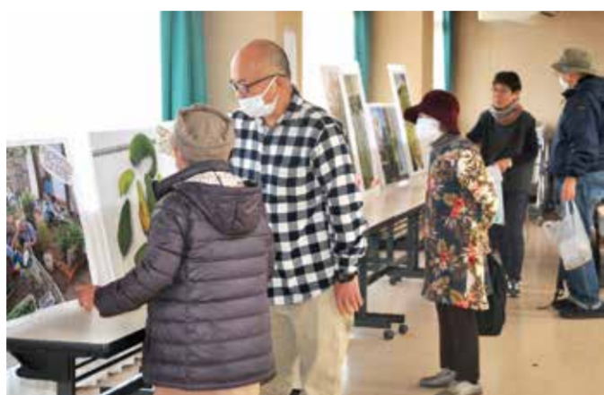
「ハチマカーテンコンクール」のようす (11/30)

水島支部は11月30日、環境問題をテーマに健康まつりを開催しました。 地域の方々にも広く呼びかけ48人の参加者がありました。コストリカバリの環境を守ったドキュメンタリー映画を上映しました。 「ハチマカーテンコンクール」ハチマタわしとヘチマ石鹸作り、班交流会など、多彩な内容で大いに盛り上がりました。参加記念品もエコ商品で、環境問題も考える一日となりました。 (水島支部 志賀雅子)