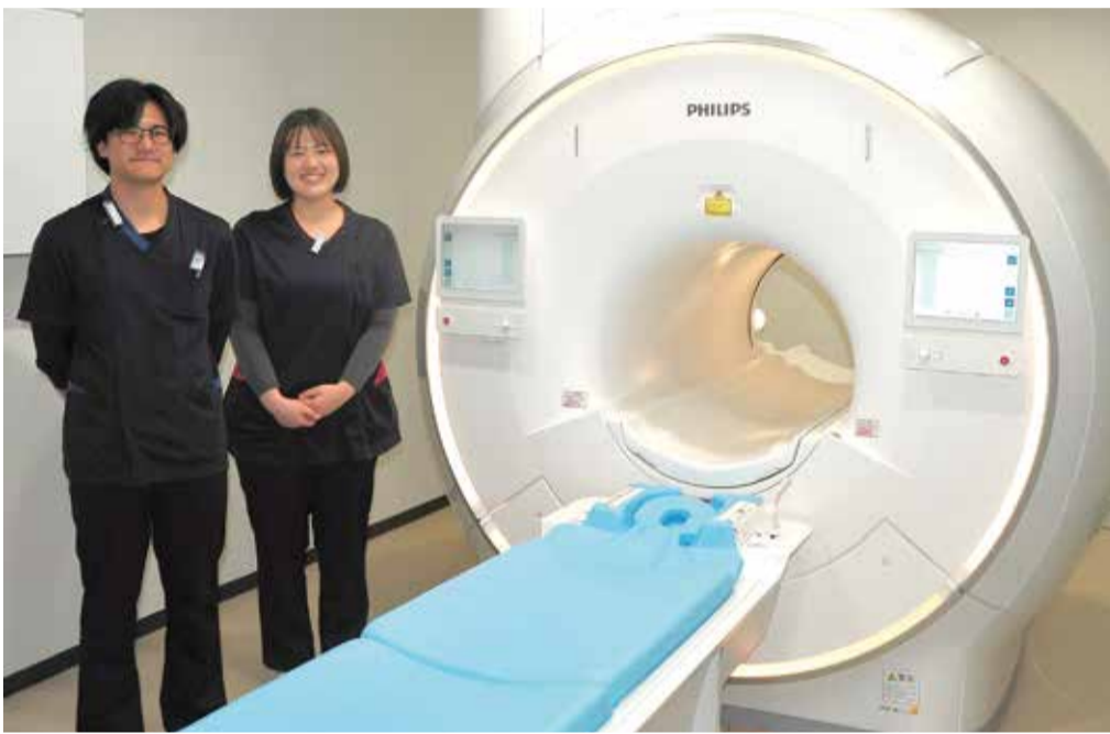
新しいMRI装置（フィリップス社製 Ambition 1.5T）

MRI検査とは、磁気共鳴画像（Magnetic Resonance Imaging）の略です。エックス線は使用せず、強い磁石と電磁波を使って体内の状態を断面像として鮮明に画像描写する検査です。特に脳や脊椎、四肢、乳房、子宮・卵巣・前立腺といった骨盤内の病変に関して優れた検出能力を持っています。