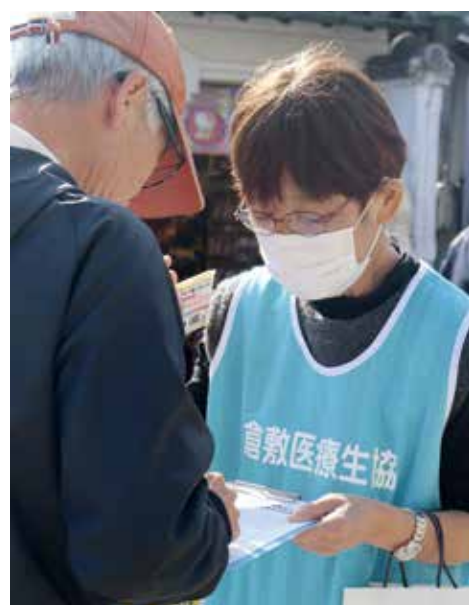
たくさんの方から署名していただきました

倉敷医療生協は11月8日、「地域医療を守れ! 白衣の緊急行動」を倉敷美観地区でおこない、職員と組合員ら84名が参加しました。