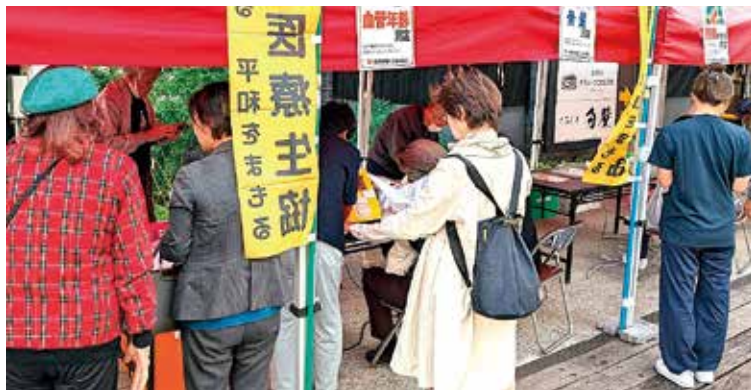
「楽しみにしていた」と、健康チェックに