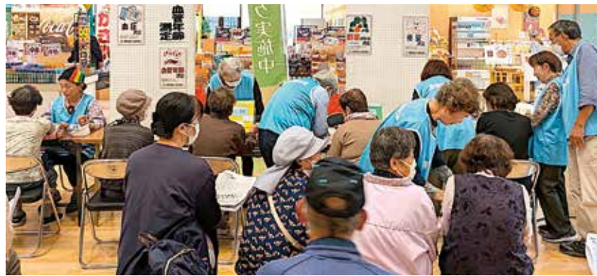
健康チェック対応に大わらわのスタッフ一同(水色ビブス)

10月22日に、高梁フロック3支部が合同で「まちかど健康チェック」をボルカ天満屋ハピータウン高梁店で開催し、59人の参加でにぎわいました。 血圧・血管年齢・野菜摂取度・骨量の健康チェックにあわせて、高梁歯科診療所の歯科医師・歯科衛生士による歯科相談もおこないました。入れ歯を失くした方が相談に来られ、「来てよかった」と喜ばれました。 この会場での久しぶりの健康チェックに、「血管年齢が若く出てうれしい」「次はいつやるの?」