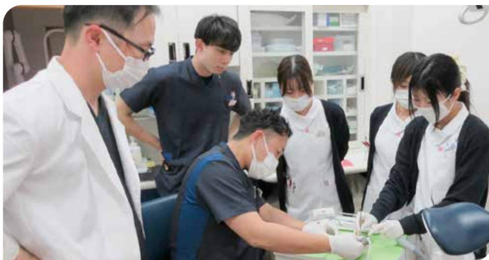
実習を行っている様子

児島歯科診療所は、平均年齢31歳の若さと活気あふれる事業所です。中堅の歯科技工士と所長が講師となり11月26日、義歯の学習会が行われました。実習では義歯の金具の材質や特性に合わせた調整を練習し、コッソリ得られるよう努めました。若手の伸びしろが児島歯科診療所の強みそのものです。教える側であるベテランも、教えることで自らの技術や知識を振り返り、整理する機会になります。お互いの存在から学び合つ、そんな関係を大切にしながら、これからも事業所の可能性を伸ばしていきたいと思