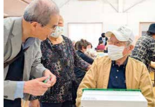
「もっと野菜を食べんといけんあ〜」

中島支部は、11月5日に平和人権学習で、ホロコースト記念館を訪れました。館長さんにホロコーストの歴史やアンネ・フランクの隠れ家のくらしなど、当時の過酷な状況を詳しく説明していただきました。アンネの日記「なぜ人間はお互いに仲良く平和に暮らせないのだろう」を読むにつれ、今なお続いている戦争の愚かさや恒久的平和の大切さを感じた一日でした。(運営委員 蒲生啓子)