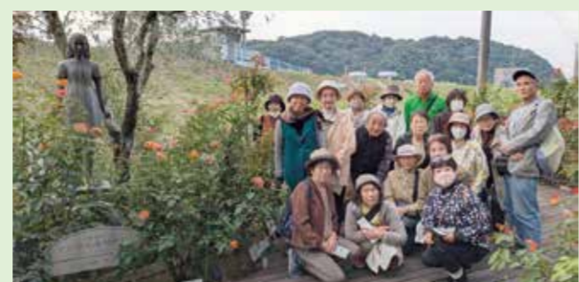
平和のシンボル “アンネのバラ” と一緒にパチリ