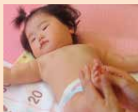
すべすべキレイになあれ♪

毎日の保湿はもちろん、乾燥する時期はクリームタイプを使うといいでしょう。頭の乾燥にはローションタイプがおすすめです。