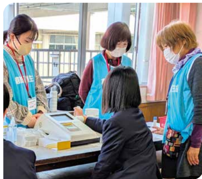
「結果はどうか？」みんなでかたずをのんで見守ります

児島ブロックでは2月12日、倉敷市立味野中学校の1・2年生に対して、児島保健推進室と協力して骨量・骨密度測定を実施しました。成長期では、骨を強く大きく成長させるためのカルシウムが必要ですが、給食の牛乳を残す生徒が多いそうです。そのため、栄養指導に取り組みうと、味野中学校から医療生協