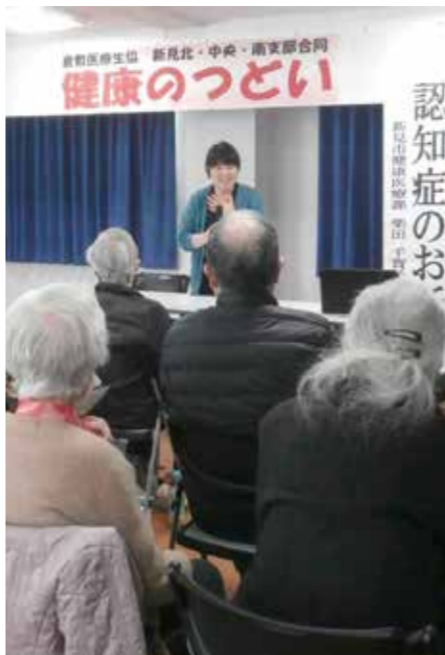
熱心に聴く参加者

老健あかねにお世話になって3か月目に入りました。寒中、運転手さん、担当の方が、いつも明るくお迎えに来てくださり、楽しく通えています。ありがとうございます。