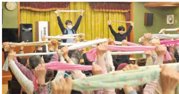
タオル体操で体のびのび～

中島支部は、2月15日に健康まつりが開催されました。水島協同病院リハビリ職員の指導でタオル体操をしました。普段からやっているが、身体の伸ばし方や、呼吸法など参考になりました。との声が上がりました。