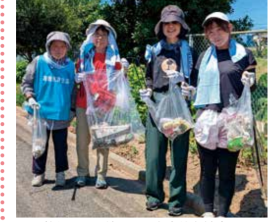
笑顔でごみ拾い! 町も身体も健康に

参加者からは「タバコの吸い殻が多かった」との感想が最も多く出され、実際に1.6kgも回収 (健康事業部 井上睦美)