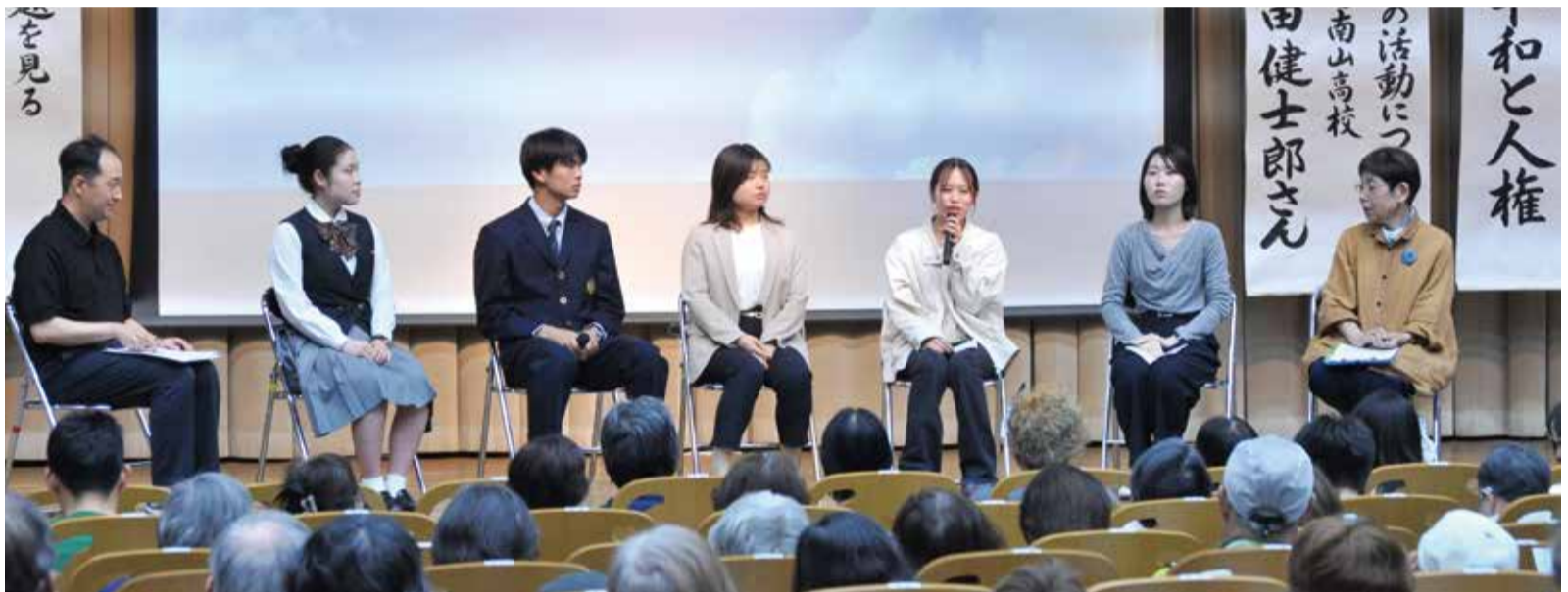
戦争と平和を「自分ごと」として考えようと話し合われたクロストーク