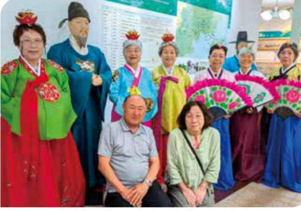
海遊文化館で民族衣装も体験しました

笠岡支部は5月21日、「健康づくりウオーキング」を瀬戸内市で開催し、8人が参加しました。この企画は、毎年1回は地域の歴史や文化を学びながら歩く企画です。牛窓地区は、江戸時代より「朝鮮通信使」が滞在していた歴史ある地域です。現存する建造物や祭り文化など、地域の歴史を感じながら汗をながしました。