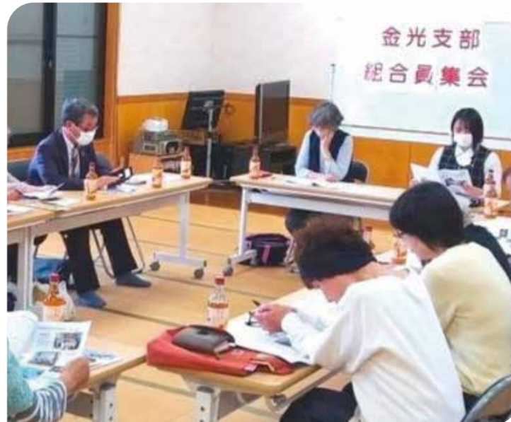
組合員も職員も、互いの取り組みに真剣に聞き入りました